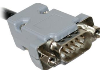
9 Pin D-Sub Anschluss