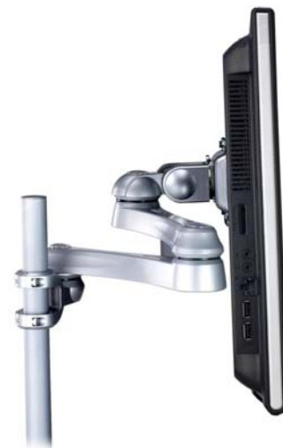
Die Bilder dienen nur zur Illustration. Software ist nicht im Lieferumfang enthalten.