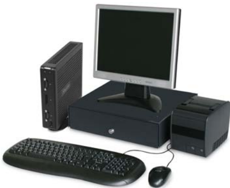
Kassensystem mit Shuttle XS 3600BA