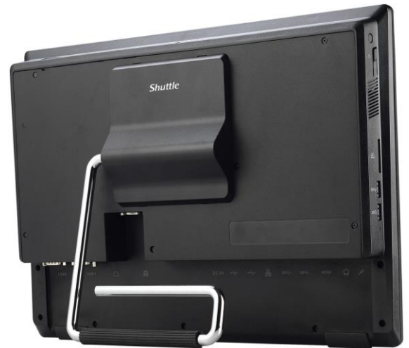
Die Bilder dienen nur zur Illustration.