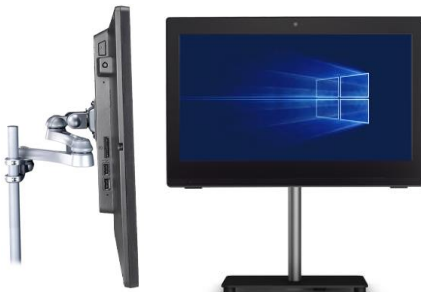
Bild rechts: Das Gerät lässt sich dann immer noch mit Hilfe einer aufgeklappten Büroklammer einschalten, die man durch ein unscheinbares Loch an der Geräteseite drückt.

Bild links: Der Einschalt-Button lässt sich deaktivieren, um unbefugtes Betätigen zu unterbinden. Hierzu öffnen Sie den PC und ziehen den entsprechenden Anschluss heraus (siehe Markierung).