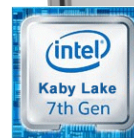
Die Bilder dienen nur zur Illustration.