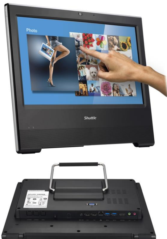
Die Bilder dienen nur zur Illustration.