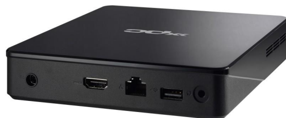
Die Bilder dienen nur zur Illustration.