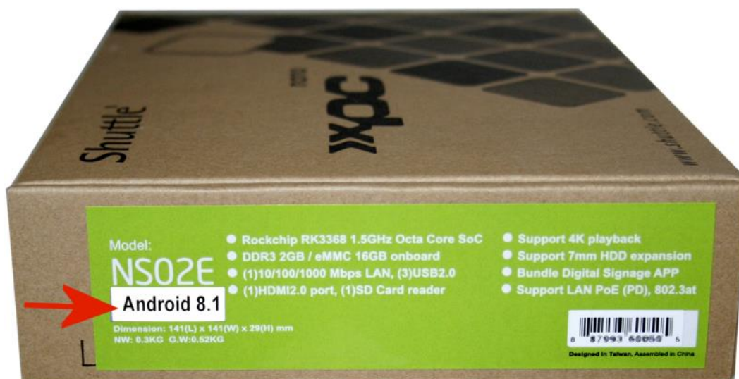
Neue Android-Version wird auf der Verpackung angezeigt.

Das NS02A/E Android 5.1 kann nicht durch den Endkunden auf Android 8.1 upgedated werden. Dies ist ein kostenpflichtiger Service von Shuttle ( support@shuttle.eu ).